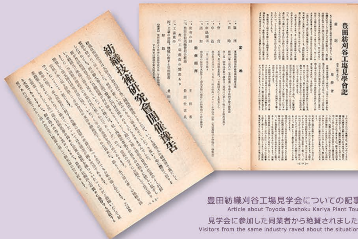
豊田紡織刈谷工場見学会についての記事 Article about Toyoda Boshoku Kariya Plant Tour

見学会に参加した同業者から絶賛されました。 Visitors from the same industry raved about the situation.