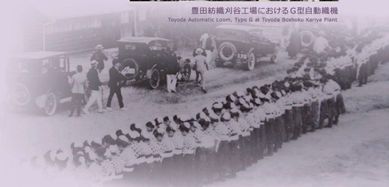
来賓を迎える豊田紡織刈谷工場の女工さん Female workers at Toyoda Boshoku's Kariya Plant welcoming visitors