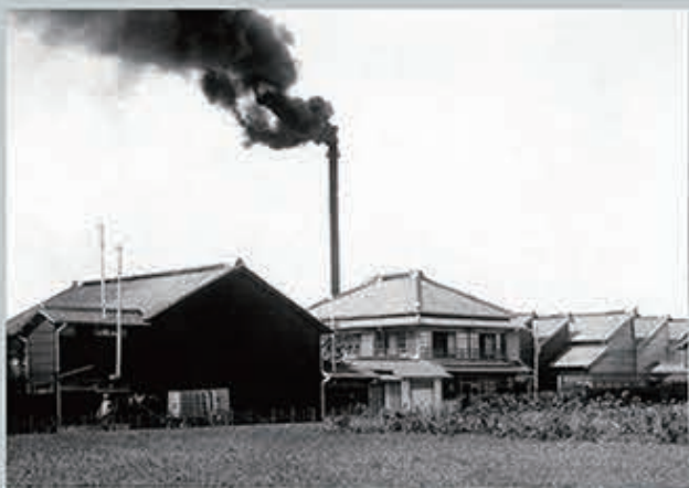
豊田自動織布工場 Toyoda Jido Shokufu Kojo (Toyoda Automatic Weaving Mill)