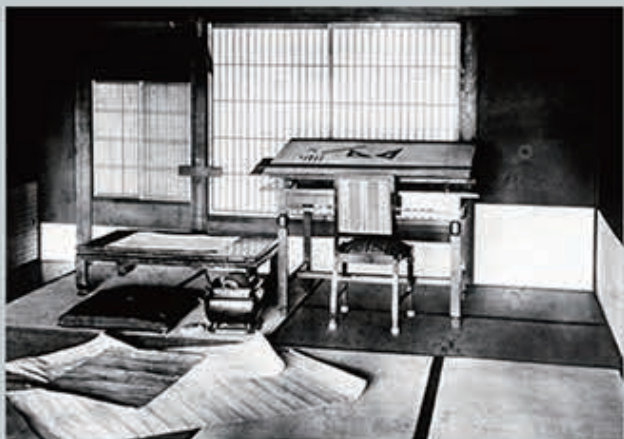
工場の2階にあった豊田佐吉の研究室 Sakichi Toyoda's laboratory on the second floor of the factory

We can say it is the birthplace of Toyota Group, since Toyoda Automatic Loom, Type G had been invented here.