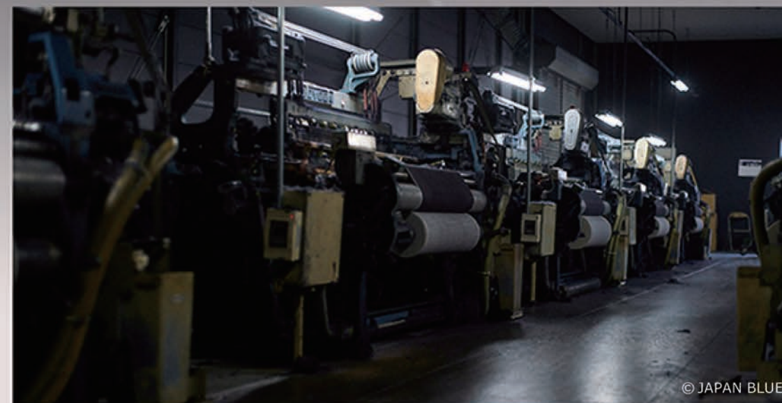
現在も稼動するGL9型自動織機 Toyota Automatic Loom, Type GL9 still in operation