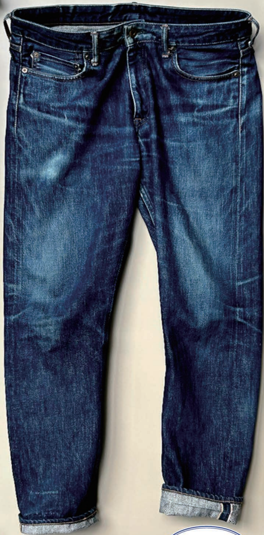
GL9型自動織機で 織られたデニムパンツ Denim pants woven on Toyota Automatic Loom, Type GL9