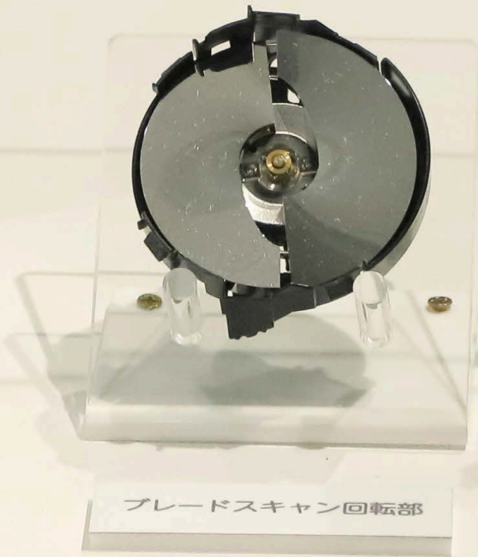
ブレードスキャン回転部