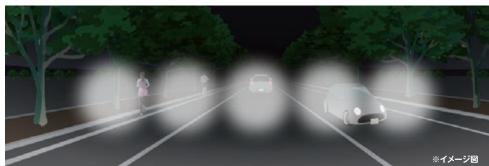
ブレードのミラーを低速回転させたときの見え方