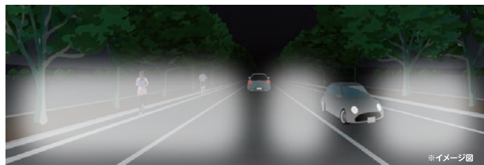
先行者に加え、対向車も走行していた場合のイメージ