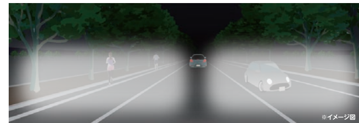
先行車が走行していた場合のイメージ