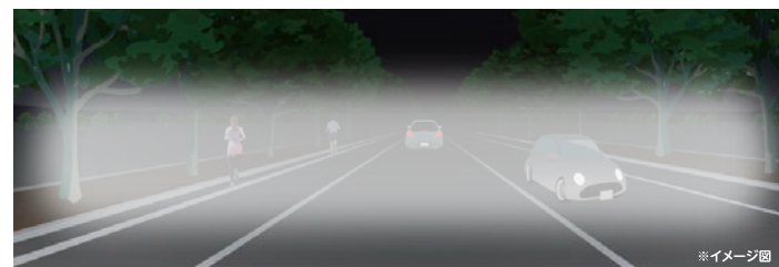
光の残像効果で安定した横長の照射パターンとなります