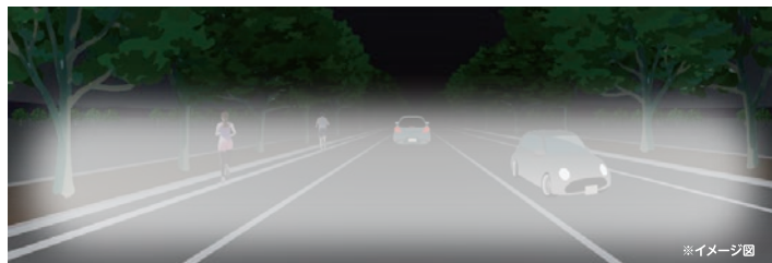
全体を照射した場合のイメージ